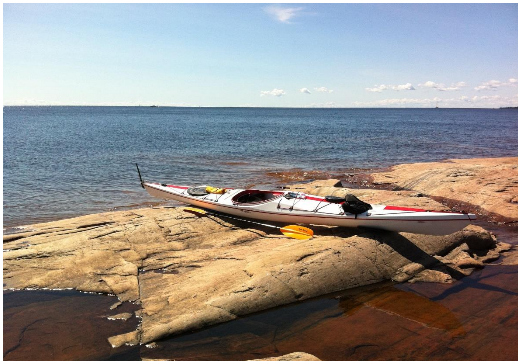
Figur 2, Utsikt från södra sidan av V.Långholmen

Karlstad på sommaren, där finns en hög brygga. På ön finns en rastplats med eldstad och dass och det finns en spång som går över till södra sidan av ön där man kan njuta av utsikten ut mot Väneren.