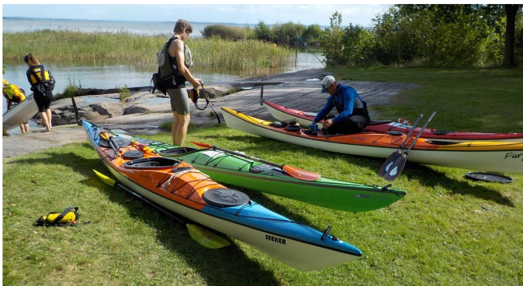
Figur 1, Sjösättning vid Ruds badplats