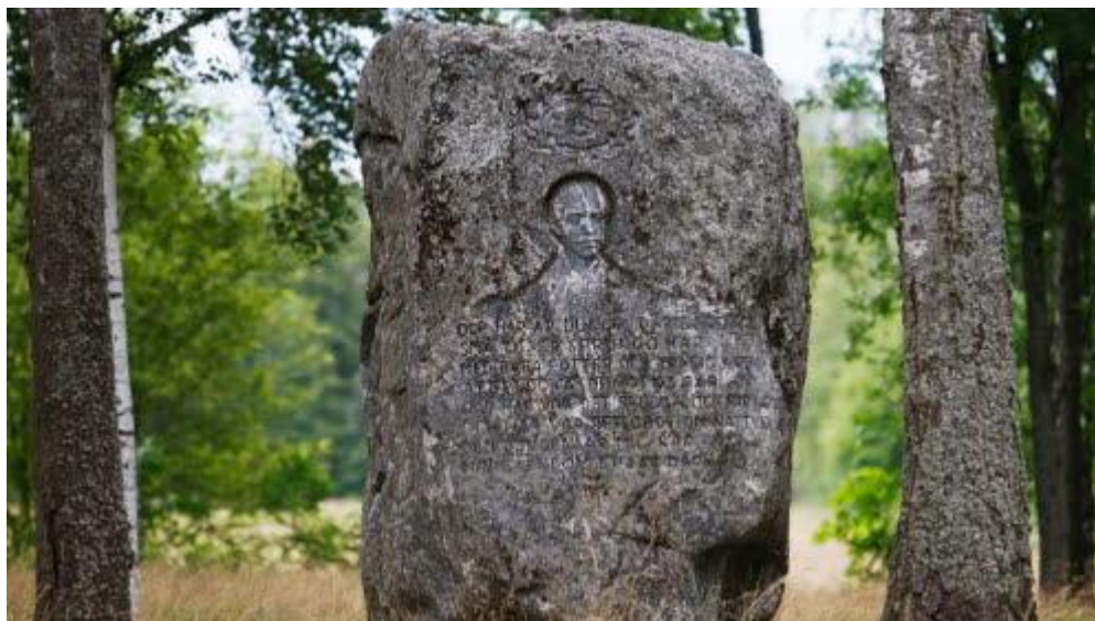
Figur 1. Del av Christian Erikssons Frödingsten

Strax norr om Alsters herrgård och E18 står Frödingstenen som invigdes år 1921 och är skapad av den värmländske bildhuggaren Christian Eriksson. I stenen finns motiv ur tre Frödingdikter: "Ett gammalt bergtroll", "En morgondröm" och "Strövtåg i hembygden".